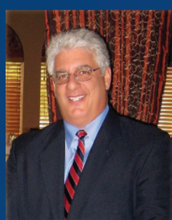
Nikolas Nikas Bioethics Defense Fund,

która przeprowadzi analizę, często przywoływanego poglądu, w myśl którego cięża i kwestie z nią związane, w tym również aborcja, są materią zarezerwowaną dla kobiet, i tym samym mężczyźni powinni być wyłączeni z dyskusji na te tematy.